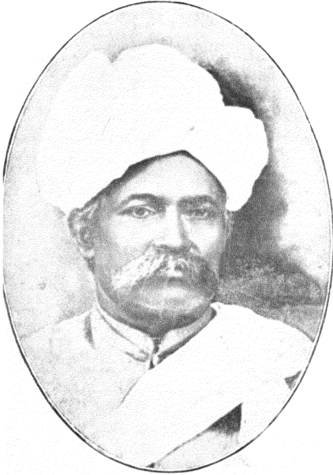
सदाशिव पांडुरंग केळकर